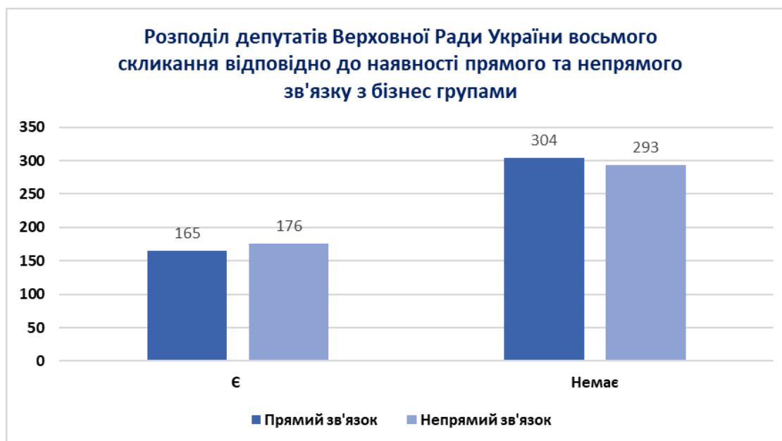
Графік 2. Розподіл депутатів Верховної Ради України 8-го скликання за наявністю прямого та непрямго зв'язку з бізнес групами.

Відповідно на Графіку 2 представлений кількісний розподіл депутатів, які мають прямий та непрямий зв'язок з бізнес групами. Відповідно 165 депутатів були визначені як ті, що мають прямий зв'язок з бізнес групами та 176, як ті, що мають зв'язок однак непрямий (тобто з бізнес групами пов'язані їх близькі родичі). Нам не вдалося знайти підтверджуючі дані щодо прямої приналежності до бізнес груп 304 депутатів та непрямой для 293 депутатів, вони були що не мають зв'язків.