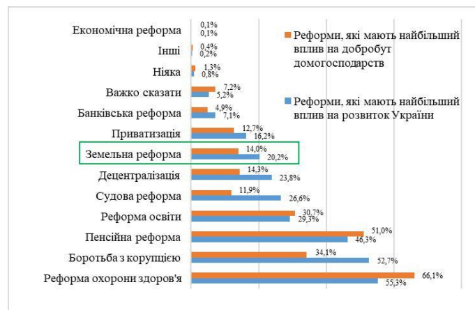
Рис. 4. Оцінка місця земельної реформи серед інших реформ. Дані: GfK **

При цьому більшість українців вважають себе необізнаними щодо земельної реформи – нічого не чули про неї 79,3% опитаних, і лише 5% вважає достатнім свій рівень знань. Тобто значна частина тих, хто висловлюється як проти реформи, так і за неї, усвідомлюють, що знають про неї недостатньо (Рис. 5), а ставлення до реформи формується переважно під впливом політичної реклами.