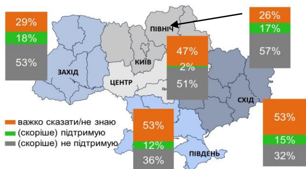
Рис.2. Чи варто надати громадянам право купувати/продавати землю, коли їм це необхідно? Рівень підтримки за регіонами, %. Дані: GfK **

Водночас у Східних регіонах рекордно низька кількість противників ринку земель – 32%, а у Північних спостерігається найбільший розрив між прихильниками й противниками – він становить 40%.