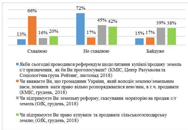
Рис. 3. Залежність результатів опитування щодо ставлення до запровадження ринку землі від поставленого запитання

ВАЖЛИВІСТЬ РЕФОРМИ ДЛЯ ГРОМАДЯН. Чутливість громадян до земельної реформи значно переоцінена політичними силами: лише 14% опитаних вважають, що земельна реформа вплине на їх добробут (Рис. 4).