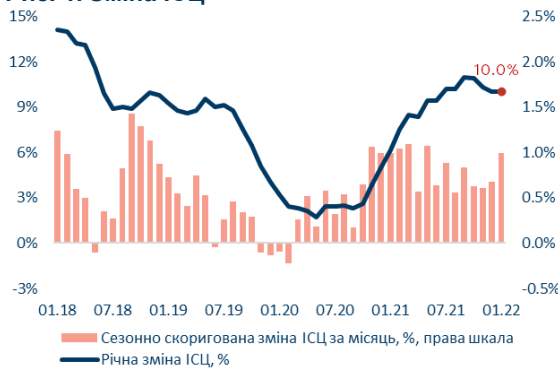
Рис. 1. Зміна ІСЦ