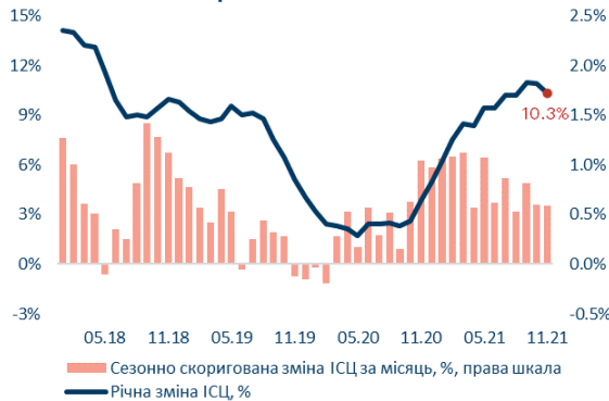
Рис. 1. Зміна ІСЦ