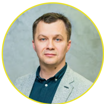
Тимофій Милованов президент KSE

Ми прагнемо побудувати процвітаючу Україну, країну успішних та заможних людей. Протягом багатьох років на заваді цьому ставали непотизм, ірраціональність та відсутність доказового підходу у процесі прийняття державних рішень. Київська школа економіки змінює це через надання полісімейкерам аналітики, що базується на даних та математичних моделях. Однак ми прагнемо не тільки змінити застарілі підходи до економічних політик, але і створити суспільний запит на них. Тому протягом 2020 року ми зосереджувались не тільки на безпосередній роботі з державними органами, але і на публічній комунікації обґрунтованих економічних політик.